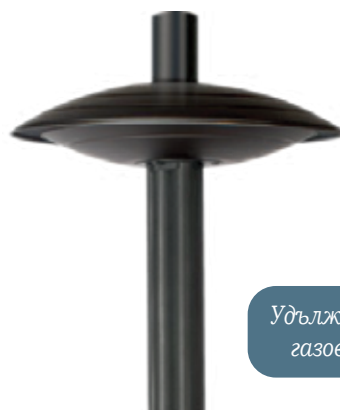
Удължение за димни газове за веранда