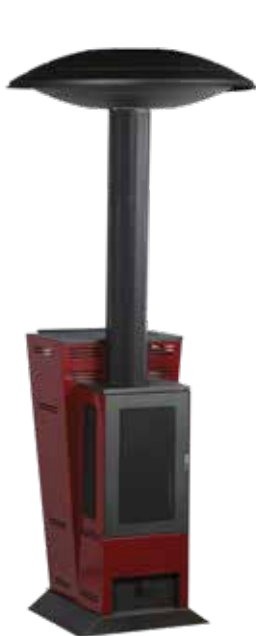
Модел за монтаж на ОТКРИТО