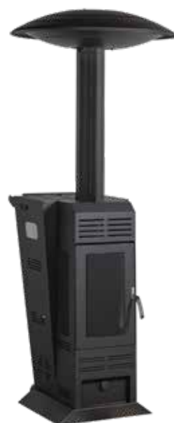
Модел с ВЕНТИЛАТОР