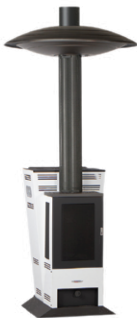
Модел за монтаж на ВЕРАНДА